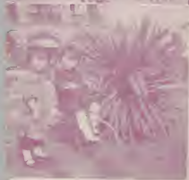
攝五頌謙) 園小之中園公